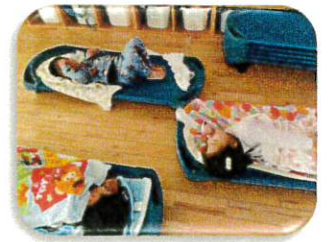
お昼寝中のはずですが…コソコソ話が