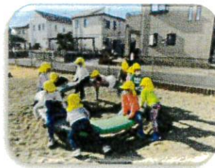
みんな回る円盤が大好き

製作時はいつだって真剣です！ハサミも上手に使えるようになりました。ひとりひとりのハサミの使い方を見ながら声掛けをしています。