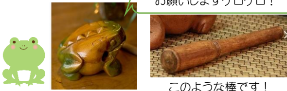
このような棒です!